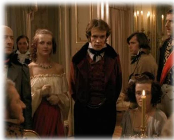
Hulanki na balu