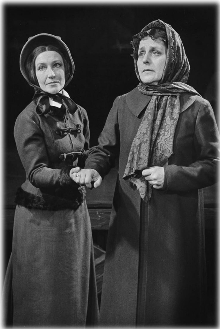
Pani Rollison na balu