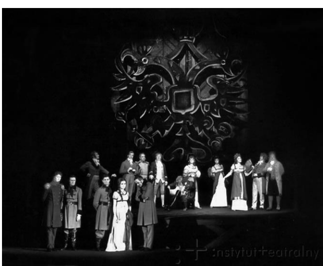
PODPIS DO OBRAZU: Bal u Nowosilcowa

Następnie jego rozmyślania przenoszą się na temat ks. Piotra, którego niezwłocznie zaczyna wypytywać skąd wiedział ksiądz tyle o młodym Rollisonie.