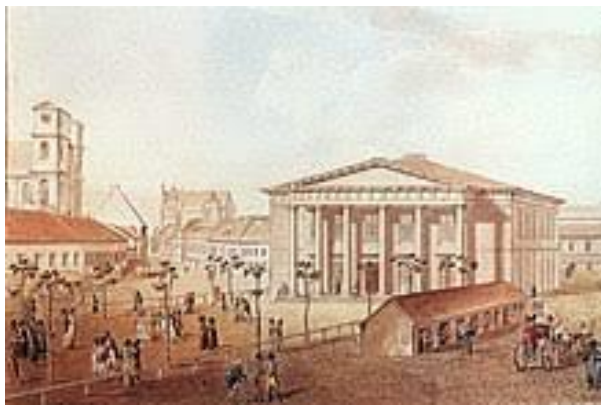
PODPIS OBRAZU: WILNO XIX W. (MARCIN ZALESKI)