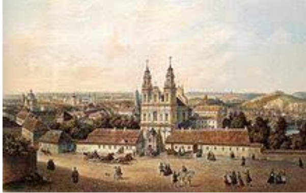
PODPIS OBRAZU: WILNO XIX W. (ZYGMENT VOGEL)